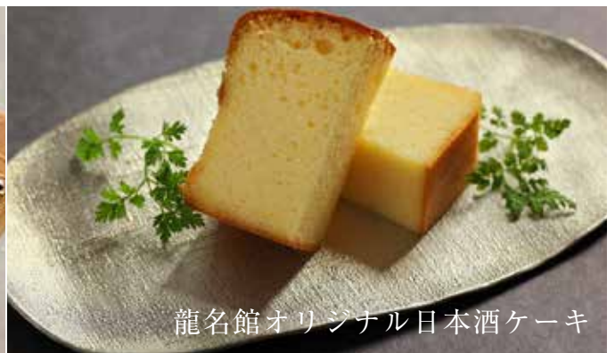
龍名館オリジナル日本酒ケーキ