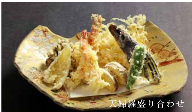
天婦羅盛り合わせ